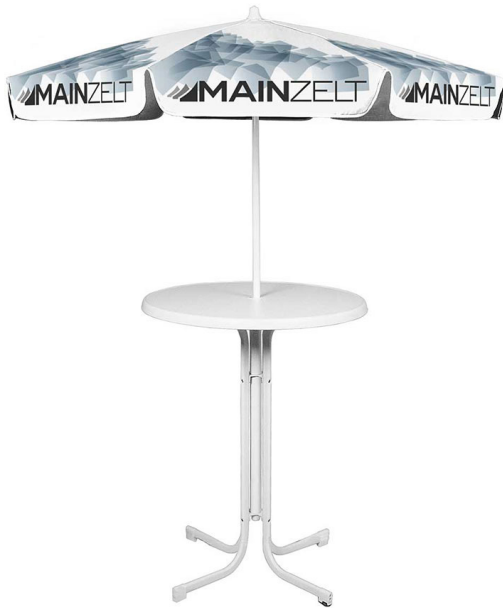
Anordnung der Segmente

Verbindungsteile: korrosionsfreiem Kunststoff